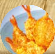
SHRIMPS SENSATION CREVETTES PANÉS SENSATION