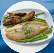
KABELJAUW FILET FILETS DE CABILLAUD SANS PEAU