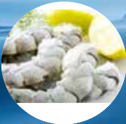
COCKTAIL GARNALEN CREVETTES ROSE